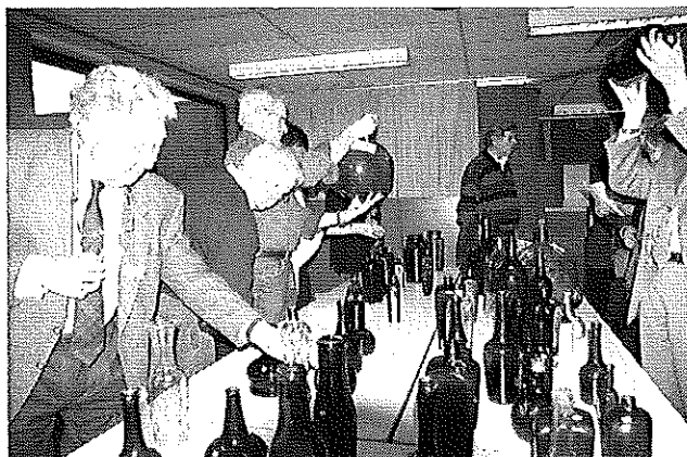
Kavels Connaisseursveiling bezichtigen.