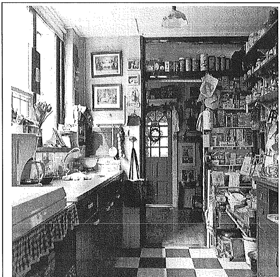
Oma's keuken.

Reacties: (M) 06-19430912 (T) 030-6993432 (E) peggydekorver@gmail.com