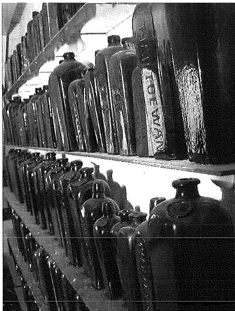
De flessen die de deur uit gaan...

Tegelijkertijd stelde ik vast dat mijn echte interesse blijkbaar wel uitgaat naar algemeen gebruiksglas. Dat is het soort glas dat internationaal aangeduid wordt als "black glass and utilities". Ook eBay kent deze categorie en dat zoekt dus gemakkelijk.