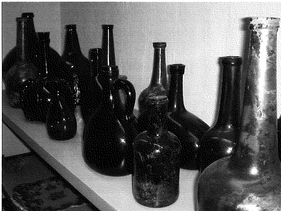
Het deel van de verzameling dat gaat uitbreiden...