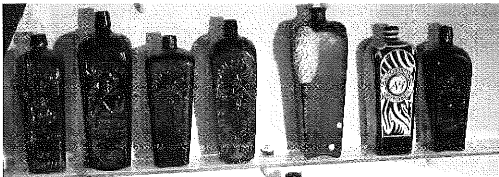
Enkele flessen waar ik geen afscheid van neem...

Kleine complicatie is natuurlijk wel dat de objecten die ik nu zo graag zou verwerven substantieel hoger geprijsd zijn dan een kelderfles, zelfs al is die fles van zeldzaam niveau. Achtkantige wijnflessen uit de 18 e eeuw, om maar eens wat te noemen, liggen immers niet voor het opscheppen. Dat geldt ook voor Franse zaadflessen wanneer je verder in de tijd wil teruggaan dan de bekende wijmondse flessen dat doen.