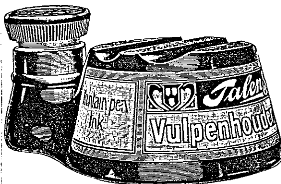
No. 422 K.

De fa. Talens gebruikte rond 1920 nog een penlegger-model, dat echter niet als zodanig in de catalogi werd genoemd. Dit flesje werd nl. aangeduid als het siphon-model , vanwege het feit dat de nek hetzelfde inktpeil behield. Dit om gemakkelijk in te kunnen dopen bij het vullen van de vulpen. Dat in die dagen nog lang niet iedereen een vulpen bezat en dat de inktfabrikant daar rekening mee hield, blijkt uit de twee dwarse uithollingen op de rug van het flesje. Deze zijn bedoeld voor het wegleggen van de penhouder, tijdens een moment van rust bij het schrijven.