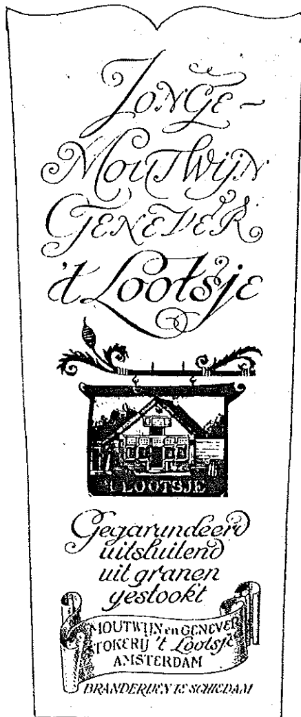
'Ontwerp Jonge Jenever A. voor Indië, 1940, voor Kelderflesch'.