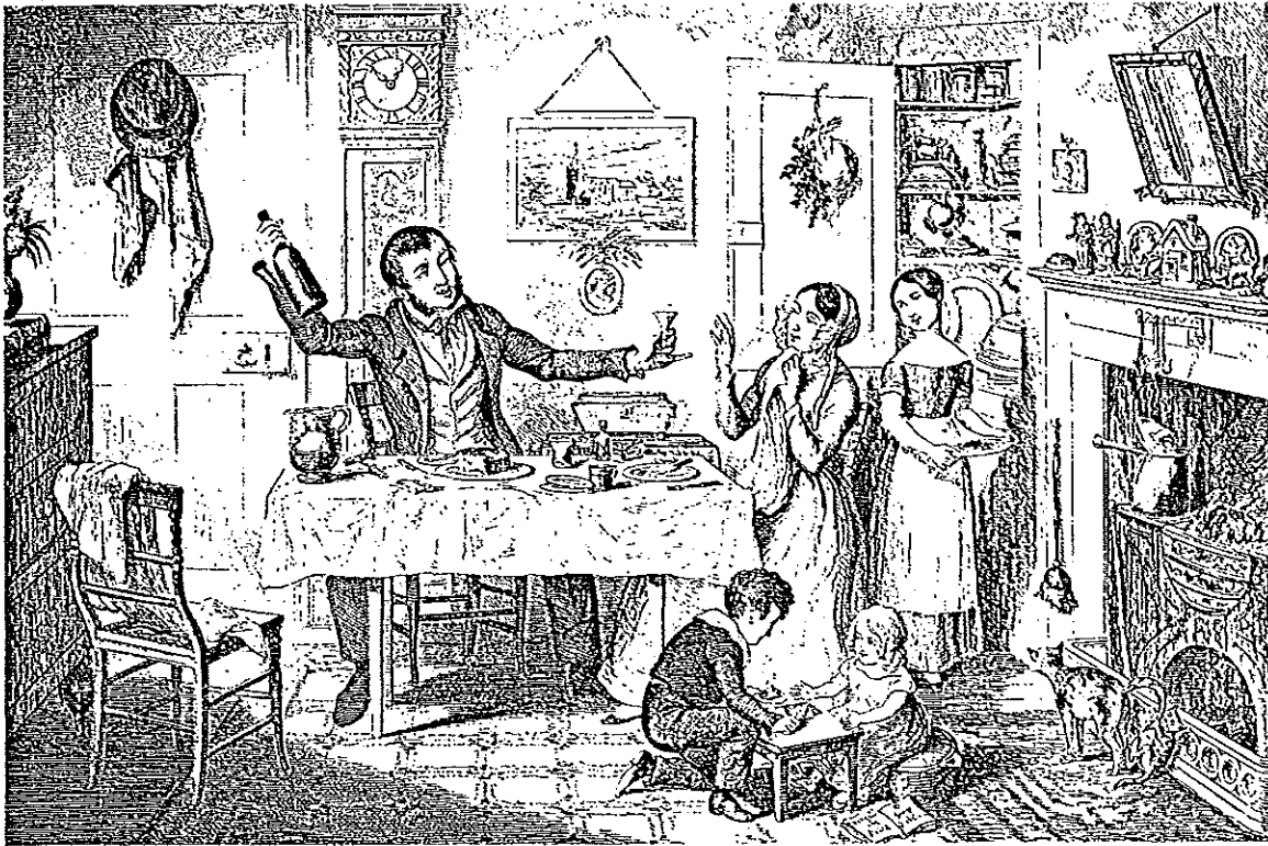
Scene I: The Bottle Is Brought Out for the First Time: The Husband Induces His Wife "Just to Take a Drop" from . . . . . The Bottle .

De komende jaren zult u regelmatig van dergelijke prenten aantreffen in ons blad. We kregen een boekje toegestuurd met daarin 16 plaatjes met dezelfde strekking: De kwalijke gevolgen van "the bottle". Hieronder de moraal die achter in datzelfde werkje opgenomen is.