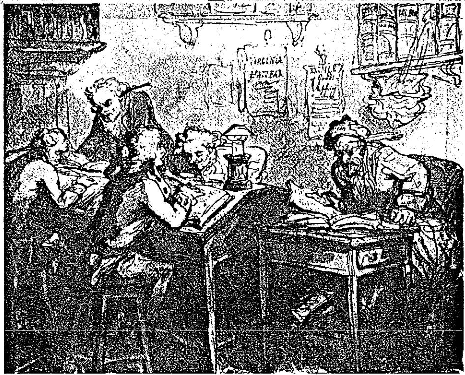
Ill. uit: A.J. Marx, Het kantoor in de loop der eeuwen, Deventer 1980.

Een schitterende uitbeelding van een kantoor uit het einde van de 18e eeuw, iets vroeger dan de periode waarover dit hoofdstuk gaat. Kantoorprenten uit die tijd zijn hoogst zeldzaam. We moeten hier te maken hebben met een exporfirma. De koopman zelf zit in een leunstoel achter zijn bureau, de vier kantoorbedienden moeten het met krukken achter de lessenaar doen. Vijf man over de boeken gebogen bij het schemerlicht van slechts één olielampje. De tekenaar Rowlandson had het beeld niet scherper kunnen vastleggen.