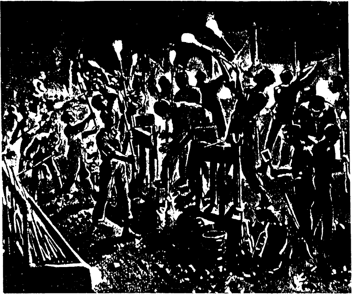
Glasblazerij bij nacht.

is, maar ook dat straks, in de dagploeg, de bekende harmonicaspeler Toon Smit zijn vrolijke deuntjes zal laten horen. Men leefde tevreden en gelukkig in de oude glashutten, waar zelfs op gezette tijden een Beiers muziekgezelschap voor de goede stemming kwam zorgen.