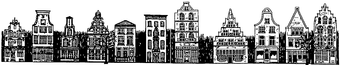
22 Veere 23 Amsterdam 24 Alkmaar 25 Gouda 26 Den Haag 27 Rotterdam 28 Rotterdam 29 Leiden 30 Delft 31 Delft 32 Delft