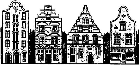
33 Rotterdam 34 Delft 35 Delft 36 Delft