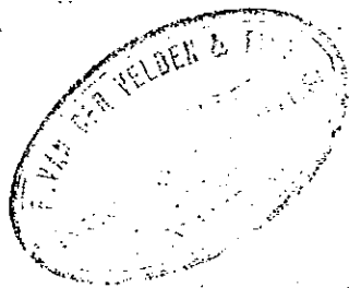
Afb 2° kaart

N.B. Wanneer bij de bestelling een postwissel gevoegd wordt, dan worden de rom- bourskosten uitgewonnen.